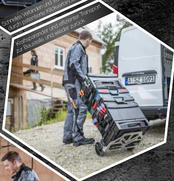
Kraftsparender und effizienter Transport zur Baustelle und wieder zurück

Sie ist die Grundlage einer Produktfamilie mit Systemgedanken. Diesen Gedanken verfolgen wir auch bei der Konzeption des standardisierten Zubehörs, mit dem die BOXen individuell an Ihre Bedürfnisse angepasst werden können.