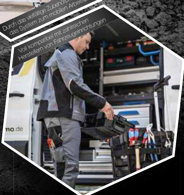
Voll kompatibel mit zahlreichen Herstellern von Fahrzeugeinrichtungen