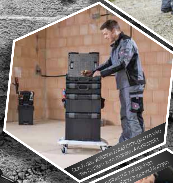
Durch das vielfältige Zubehörprogramm wird das System zum mobilen Arbeitsplatz