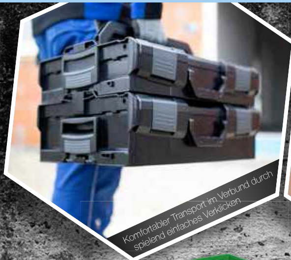
Komfortabler Transport im Verbund durch spielend einfaches Verklücken