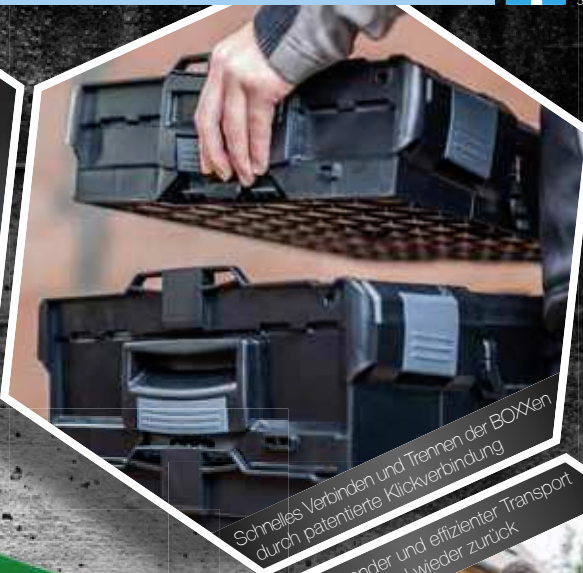
Schnelles Verbinden und Trennen der BOXen durch patentierte Klickverbindung